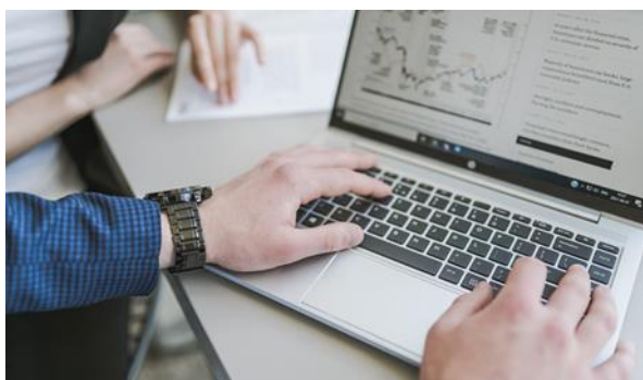
Bibliotekos mokymai lapkričio 22, 23, 25 d.