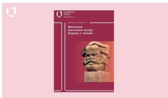
Nauja VILNIUS TECH knyga