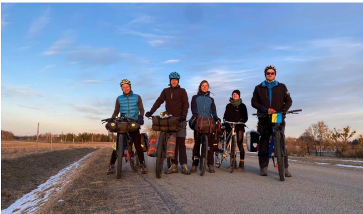
Kviečiame į parodą „VILNIUS TECH turistų klubui – 50“