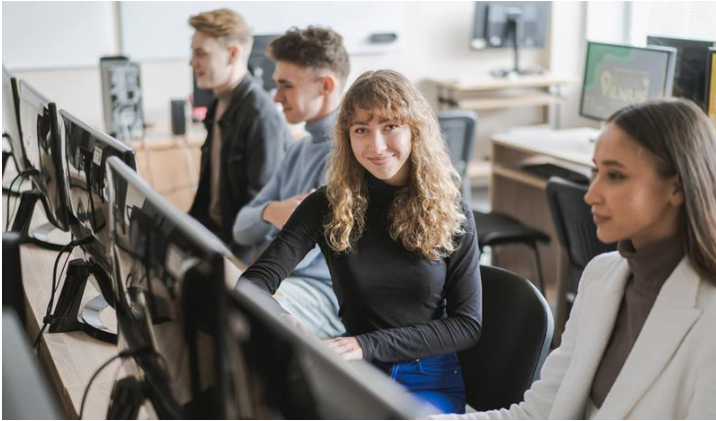
Bibliotekos mokymai rugsėjo mėnesį