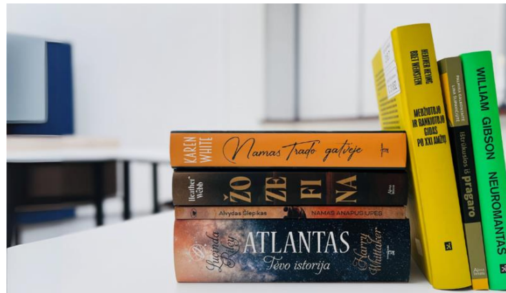
VILNIUS TECH SKAITO vasarą: naujausios knygos laisvalaikio skaitiniams