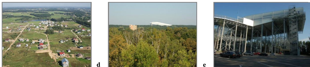
9 pav. Architektūros objektai kaip daiktinės aplinkos formantai, nepalaikantys (šiuo atveju) darnios visumos formų sambūvio. Vilniaus rajono (d); Druskininkų m. (e), (f) savivaldybių pavyzdžiai