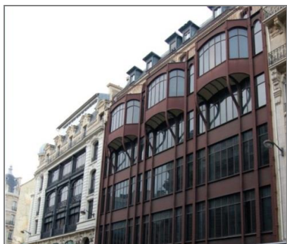
4 pav. Pastatas rue Reaumur Nr. 124 Paryžiuje (1905 m.). Pramonės gaminių dizaino priemonėmis (plieno konstrukcijomis) dekoruotas pastatas. Architektas-dizaineris Georges Chedanne