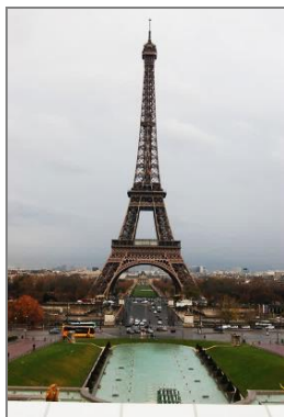
5 pav. Eifelio bokšto prieigos kaip estetiškai vientisos miesto erdvės būdingos pramoninio meno laikotarpiui. Eifelio bokštas kaip Paryžiaus tapatumo simbolis

Loginis mąstymas, industrinė gamyba, standartų įsigalėjimas tapo inžinierinio dizaino pagrindas, o architektų, gamybos inžinierių ar menininkų kasdieninio darbo įrankiu. „Priartėta“ prie siekiamybės matematiškai aprašyti grožį, nes daiktų forma pvz., turi aiškius fizinius parametrus, spalvą, tūrį ir t. t. (4, 5 ir 6 pav.).