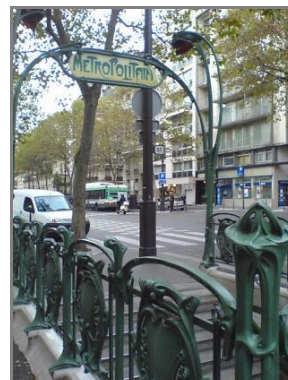
6 pav. Paryžiaus metro (1900 m.). Meninio projektavimo pramonei pavyzdys. Architektas-dizaineris H. Guimard

Fig. 5. The material environment design from period of the industrial revolution in Paris