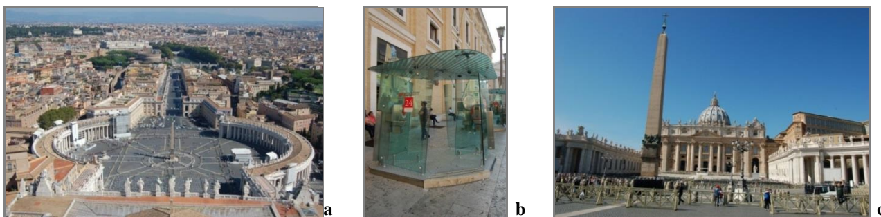
2 pav. Architektūra kaip gero amato ir harmoningo sambūvio rezultatas Romos Šv. Petro Bazilikos renesansinės aikštės (archit. D. L. Bernini) (a), (c), (b) pavyzdžiu

konstruktoriai, ir menininkai ir teoretikai. Tačiau palaipsniui šios veiklos diferencijavosi ir XV a. susiformavo pakankamai savarankiška menininko profesija ( Pripažįstama, kad tik XIX a., pramoninės revoliucijos epochoje menas tapo nepriklausomas. ). Tai turėjo įtakos miesto erdvių palaipsniam papildymui meno kūriniais, „gero“ amato (utilitariais) ir dizaino (estetiškais) objektais. Architektūriniai objektai, jų formuojamos erdvės, įvairūs gaminiai erdvėse kaip daiktinės aplinkos elementai tapo fundamentaliais konkreto laikotarpio kultūros ir harmoningo sambūvio liudytojais (2 pav.).