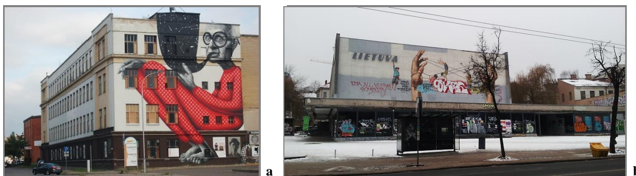
10 pav. Daiktinės aplinkos menko sambūvio visumos kaip miesto erdvių formų destruktuvios aplinkos pavyzdžiai Kauno (a) ir Vilniaus miestų senamiesčiuose (b)